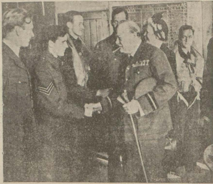
B. Çörçil İngiliz tayyareleriyle görüşürken